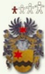
Blason des Dubich.