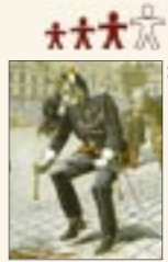
Le Mulhousien Alfred Dreyfus, dont le sort a divisé la France fin XIX e .